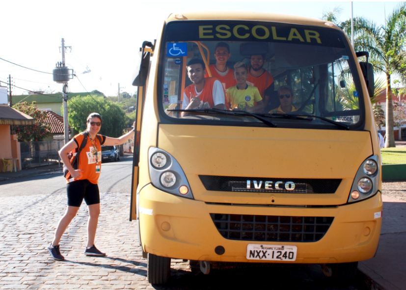
"Live action' do logotipo do IFTM Itinerante, durante a passagem do projeto por Campo Florido (MG)."